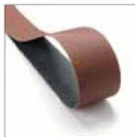
Pás 2000 x 75 mm, zrnitost 80, standard pro BS 975 obj. č. 701019