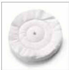
Leštící kotouč flanelový ø 200 x 20 x 10 mm obj. č. 700821