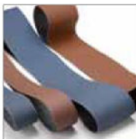
hnědý pro běžné použití a modrý pro hliník a nerezavějící ocel

2000 x 150 mm, zrnitost 40 BS 9150 modrý pro hliník/nerez obj. č. 701085