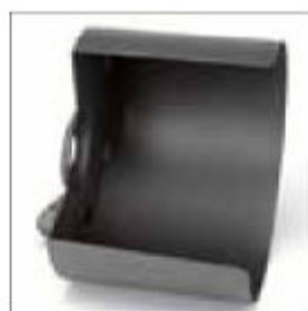
Leštící kryt ø 300 mm pro BSS 9250, pravý, s připojením na odsávání prachu ø 50 mm obj. č. 202444