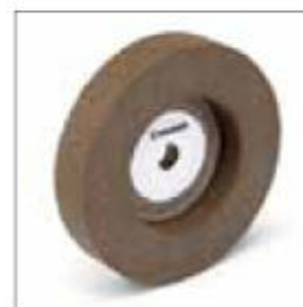
Brusný kotouč ø 200 x 40 x 20 mm, zrnitost 60, pro VSS 9200 obj. č. 700612