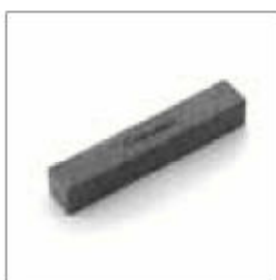
Orovnávací kámen pro zdrsňení, opravu a čištění brusného kotouče. obj. č. 900284