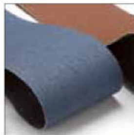
Pásy 2000 x 150 mm, zrnitost 80, pro BS 9150, modrý pro hliník/nerez obj. č. 701074