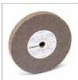
Brusný kotouč ø 200 x 25 x 20 mm, zrnitost 36 obj. č. 700238