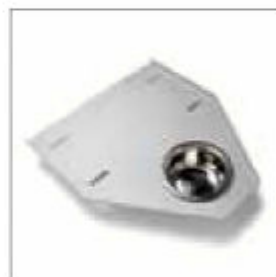
Stolek na nářadí a miska na vodu k podstavci obj. č. 370117