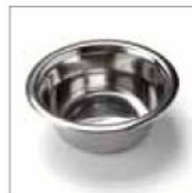
Miska na vodu ke stolku na nářadí obj. č. 900889