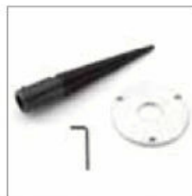
Kónické vřeteno levé pro DS 9200/9250, průměr hřídele 20 mm obj. č. 900526