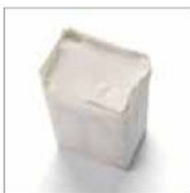
Leštící pasta univerzální obj. č. 900240