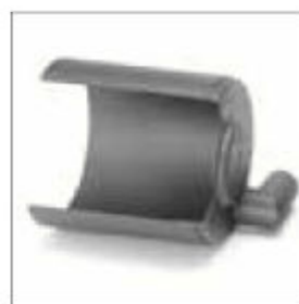
Leštící kryt ø 200 mm, levý, s připojením na odsávání prachu ø 50 mm obj. č. 202411