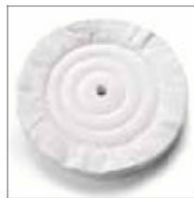
Leštící kotouč flanelový ø 300 x 30 x 20 mm obj. č. 700830