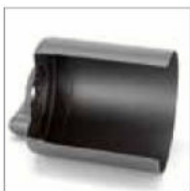
Leštící kryt ø 200 mm pro BSS 9200, pravý, s připojením na odsávání prachu ø 50 mm obj. č. 202422