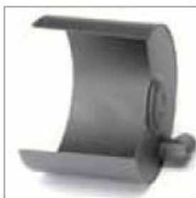
Leštící kryt ø 300 mm, levý, s připojením na odsávání prachu ø 50 mm obj. č. 202433