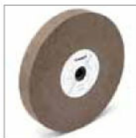
Brusný kotouč ø 300 x 40 x 25 mm, zrnitost 60 obj. č. 700315