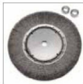
Ocelový kartáč ø 300 x 26 x 25 mm s vymešovými kroužky obj. č. 700425