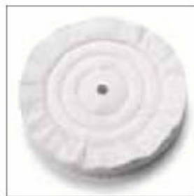
Leštící kotouč plátěný ø 300 x 30 x 20 mm obj. č. 700825