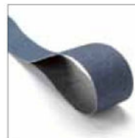
Pás 2000 x 75 mm, zrnitost 80, modrý pro hliník/nerez, pro BS 975 obj. č. 701030