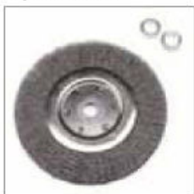
Ocelový kartáč ø 200 x 22 x 20 mm s vymešovými kroužky obj. č. 700403