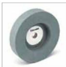
Brusný kotouč ø 200 x 40 x 20 mm, zrnitost 120, pro VSS 9200 obj. č. 700832