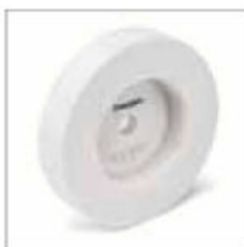
Brusný kotouč ø 200 x 40 x 20 mm, zrnitost 80, WA, pro VSS 9200 obj. č. 700645