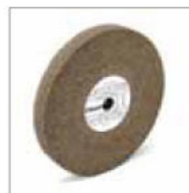
Brusný kotouč ø 250 x 30 x 20 mm, zrnitost 36 obj. č. 700260