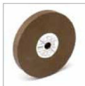
Brusný kotouč ø 200 x 25 x 20 mm, zrnitost 80 obj. č. 700249