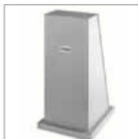
Univerzální podstavec K9000HD tlustostěnný ocelový plech, 4 mm obj. č. 007436