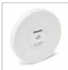
Brusný kotouč ø 200 x 25 x 20 mm, zrnitost 60 bílý obj. č. 700216