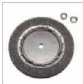
Ocelový kartáč ø 250 x 22 x 20 mm s vymešovými kroužky obj. č. 700414