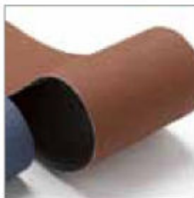
Pásy 2000 x 150 mm, zrnitost 80, standard pro BS 9150 obj. č. 701063