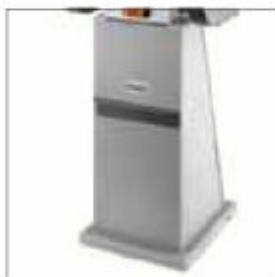
Podstavec AK 9000HD s integrováním odsávání prachu obj. č. 007425