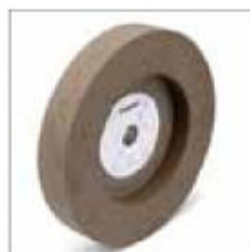
Brusný kotouč ø 300 x 50 x 25 mm, zrnitost 60, pro VSS 9300 obj. č. 700337