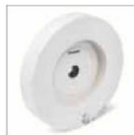
Brusný kotouč ø 300 x 50 x 25 mm, zrnitost 80, WA, pro VSS 9300 obj. č. 700634