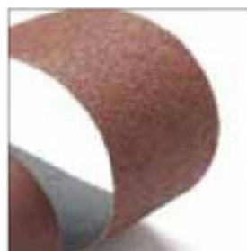
Pás 1300 x 75 mm, zrnitost 40, pro BSS/BSD obj. č. 700953