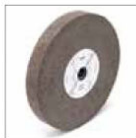
Brusný kotouč ø 300 x 40 x 25 mm, zrnitost 36 obj. č. 700304