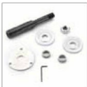
Nástawné vřeteno pro DS 9200/9250 levé, průměr hřídele 20 mm obj. č. 900537