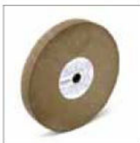
Brusný kotouč ø 250 x 30 x 20 mm, zrnitost 80 obj. č. 700271