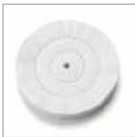
Leštící kotouč plátěný ø 200 x 20 x 10 mm obj. č. 700810