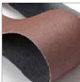
Pás 1300 x 75 mm, zrnitost 80, pro BSS/BSD obj. č. 700975

1300 x 75 mm, zrnitost 40 BSS/BSD obj. č. 700953