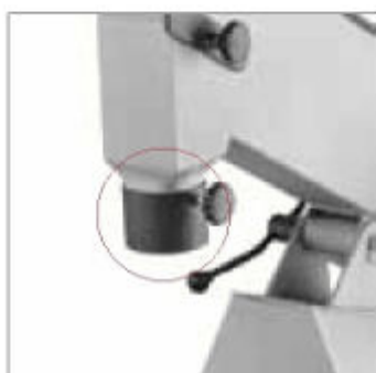
Lapač jisker pro třísky