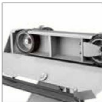
Robustní příčná konstrukce