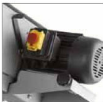
Pětiletá záruka na motor