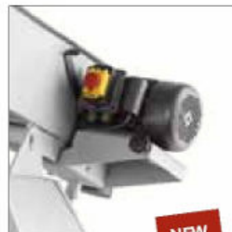
BS 975HD 1~