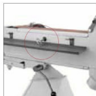
Kryt uzamykatelný klíčem