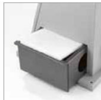
Snadno vyměnitelný tepluvzdorný filtr v zásobníku