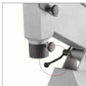
Snadno nastavitelná pracovní výška