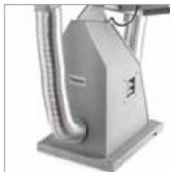
Dvojité odsávání opatřené hliníkovými odsávacími hadicemi