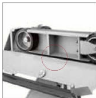
Odsávací tunel pro odvádění prachu a třísek