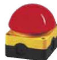
nožní vypínač s bezpečnostním přerušením napájení

Rozměr brusného pásu d x š: 2000 x 150 mm