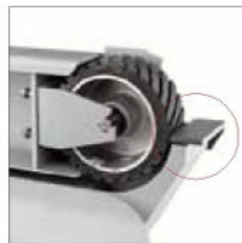
Tvrzená podpora obrobku