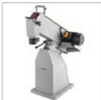
Tlustostěnný ocelový plech, 4 mm Zcela smontovaná s kabelem