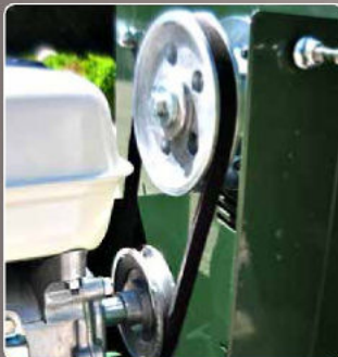
Trasmisione a cinghia con puleggia Belt transmission with pulley Transmission à courroie avec poulie Transmisión por correa con polea Keilriemenantrieb Aandrijving met V-snaar en riemschijf Ременная трансмиссия со шкивом

De biohakselaar R95 is leverbaar in een versie met motoraanrijving: driefasige elektomotor of benzine motor ofwel in een versie voor aandrijving door een tractor met driepunt aankoppeling. Hij verkleint de moerstanden, takken van heggen, snoeihout van kleine groenzones met een maximale takdiameter van 70 mm. Belangrijke eigenschappen van de biohakselaar R95 zijn: de aanwezigheid van een enkele aanvoertrechter waar u alle groenafval kan inbrengen en zijn riemaandrijving bij de modellen met motor of de elastische verbinding bij de modellen met aandrijving voor tractor waardoor de machine beveiligd is, ook bij het inbrengen van ongeschikt materiaal. De hakselgroep is uitgerust met een voorspannes dat voor een eerste versnippering zorgt. Vervolgens worden de snippers verder verkleind door 8 bewegende hammers. De fijnheid is regelbaar via een instelbaar rooster. Het uitwerpen van het verwerkte materiaal wordt verzekerd door drie schoppen die zich in de hakselgroep bevinden en het materiaal naar buiten stuwten via een kleine uitwerppijp op een hoogte van 116 cm vanaf de bodem. Er is een sterk zuigeffect in de aanvoertrechter. Dat vergemakkelijkt het hakselen van bloeden en groen materiaal. De machine is stevig gebouwd, eenvoudig te gebruiken en gemakkelijk te verplaatsen dankzij de twee grote wielen. Ze beantwoordt aan de norm EN 13683 + A2 - 2011.