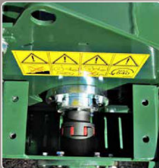
Trasmisione per versione a trattore Transmission for tractor version Transmission pour version à tracteur Transmisión para versión de tractor Antrieb für Traktor Version Aandrijving voor uitvoering voor tractor Трансмиссия для версии с приводом от трактора