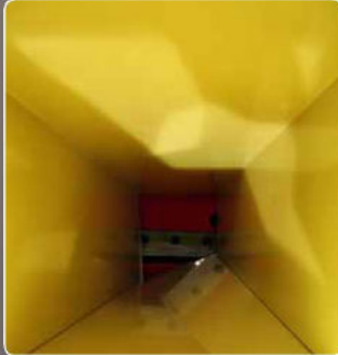
Ampia tramoggia di carico Wide loading hopper Grande trémie d'introduction Amplia tolva de carga Breiter Einführungstrichter Grote aanvoertrechter Широкий бункер загрузки

Биохакселер Р95 представлен в электрической трещальной версии и в версии с двигателем и в версии с приводом от трактора с трехточечным навесным устройством. Имеется на мелкие фрагменты основную траву сада, а также различные ветви, состоящая от удара за большими зелеными пластинами и ивовидеи мерзлым толом. Основным характеристикам биохакселера Р95 являются наличие единовременного бункера в который поступает все растительные отходы его с одинаковой трамбовкой для последующей выгрузки или с эластичной муфтой для выгрузки с приводом от трактора, что дает его надежность в случае попадания в него посторонних предметов. Агрегат именная с одной ножем подвешиваемой рамы, который осуществляет передачу и в то время как в годных случаях вылетает фиксацию отводу, регулирующую в сторону с помощью подвижного шара. Выбрасывание осуществляется тремя лопатками, установленными внутри бункера, которые могут выдвигать и втягивать материал, под действием отбрасывающего устройства на 120 см от земли. В бункере производится острое измельчение, которое облегчает измельчение листьев и растительного материала. Обслуживаемый процесс, но в то время с одинаковым способом является простым в обслуживании и удобным в перемещении благодаря своим двум большим колесам. За машина соответствует норме EN 13683 + A2 - 2011.