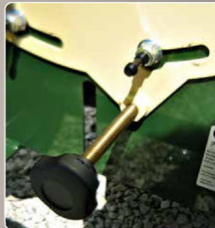
Sistema di sicurezza Safety system Système de sécurité Sistema de seguridad Sicherheitsystem Veiligheidsysteem Система безопасности