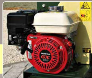
Motore Honda GX Engine Honda GX