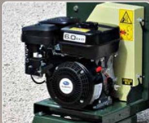
Motore Subaru HP 6 Engine Subaru HP 6