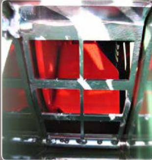
Vaglio mobile in dotazione Issued with mobile screen Crible mobile en dotación Cribador móvil en dotación Bewegliches Setzsieb inbegriffen Instelbaar rooster is standaard Подвижное сито в стандартной комплектации