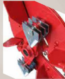
Rotore di triturazione con lama di pretaglio e martelletti mobili posteriori