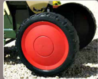
Ruote di grandi dimensioni Large wheels for an easy transport Roues de grandes dimensions pour les déplacements Ruedas de grandes dimensiones para un fácil traslado Große Räder für die Verlagerung Grote wielen voor gemakkelijk transport Колеса больших размеров