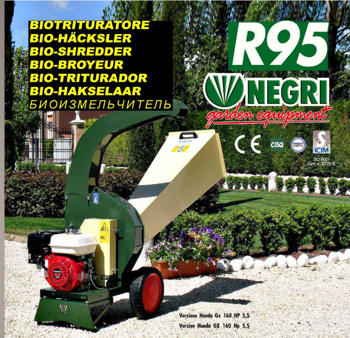
Versione Honda Gx 160 HP 5,5 Version Honda GX 160 Hp 5,5