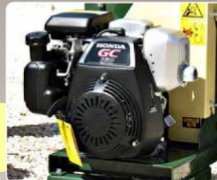
Motore Honda GC Engine Honda GC