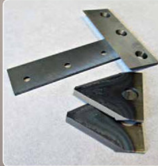
Utensili qualitativamente testati con marchio originale Quality tested tools with trade-mark Outils de coupe testés qualitativement avec marque de fabrication La herramienta lleva marca original y su calidad está probada Getesteerde Qualitäts-Schneidwerkzeuge mit originalem Markenzeichens Op kwaliteit geteste gereedschappen met het originele merk Юзельные инструменты испытаны с оригинальной торговой маркой