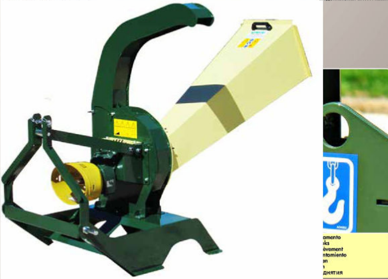
amonto ics èvement niamiento an 1 днтия