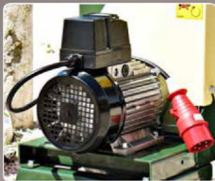
Motore elettrico Electrical engine