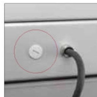
Na zadní straně základny brusky je standardně umístěn druhý vstup pro připojení k podstavci AK 9000HD