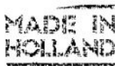
Kvalitní holandský výrobek

kvalitní holandský výrobek vysoký výkon výborně vyvážená nízká úroveň vibrací za provozu nízká hlučnost pracovní plocha nastavitelná na 90° až 45° rozšířený brusný kotouč ideální s podstavcem záruční doba 5 let