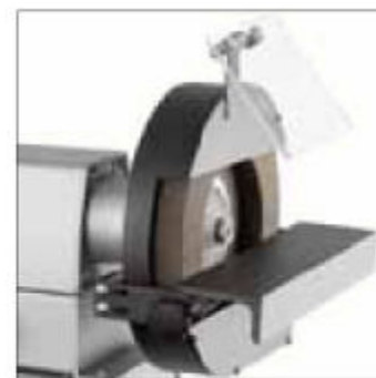
Rozšířený kotouč pro práci v ostrém úhlu nebo poloměru