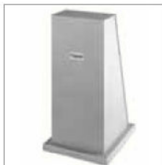
Univerzální podstavec K 9000HD, tlustostěnný ocelový plech, 4 mm