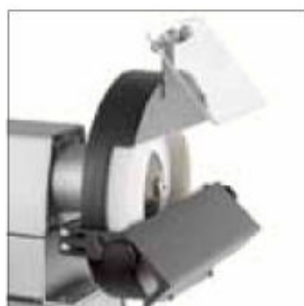
Ocelová pracovní plocha lze nastavit do polohy 90 až 45°