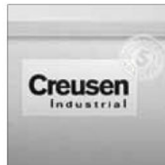
Záruční doba 5 let