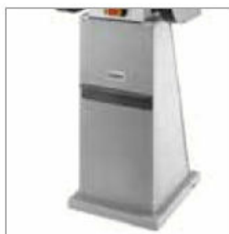
Ideální v kombinaci s podstavcem AK9000HD s integrovaným odsáváním prachu