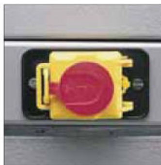
Vypínač s podpěťovou spouští a nouzovým přerušením napájení