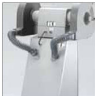
Připojení k odsávání prachu je na obou stranách, ø50 mm